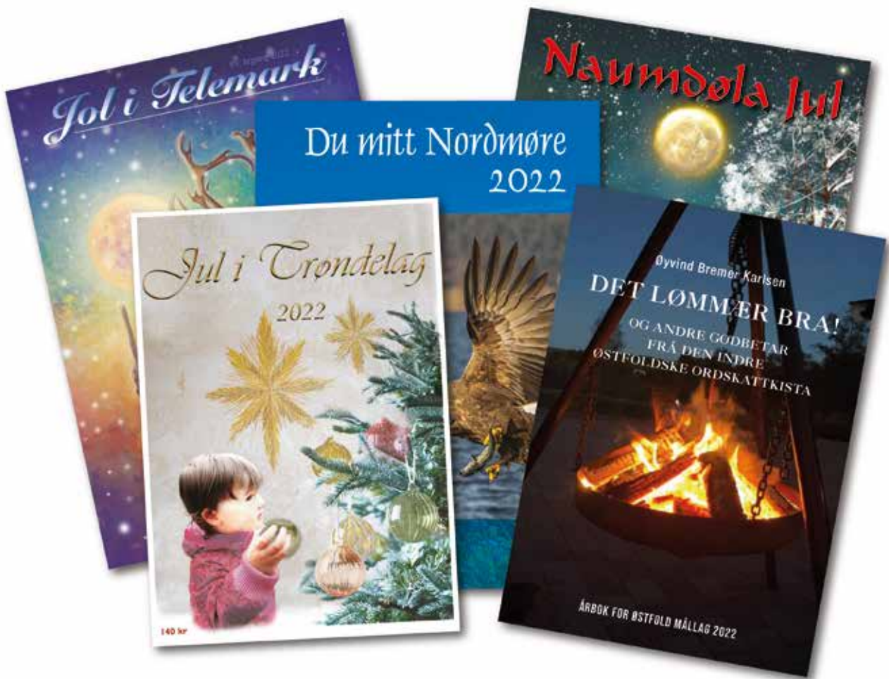
Nokre av dei fine julehefte lokallag og fylkesmållag gir ut kvart år. For første gong var dei til sals i Krambua til Noregs Mållag.

2023 var også året to nynorskbøker vart Brageprisvinnarar. Frode Gryttens Den dagen Nils Vik døde vart årets bok, og Maria Parr vann pris for beste barne- og ungdomsbok; Oskar og eg . I tillegg fylte Skald forlag 30 år i september. 2023 var eit skikkeleg festår for nynorsklitteraturen.