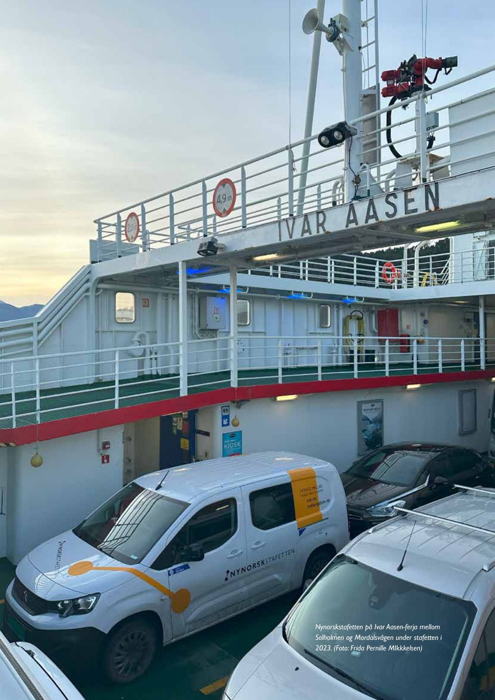
Nynorskstafetten på Ivar Aasen-ferja mellom Solholmen og Mordalsvågen under stafetten i 2023.