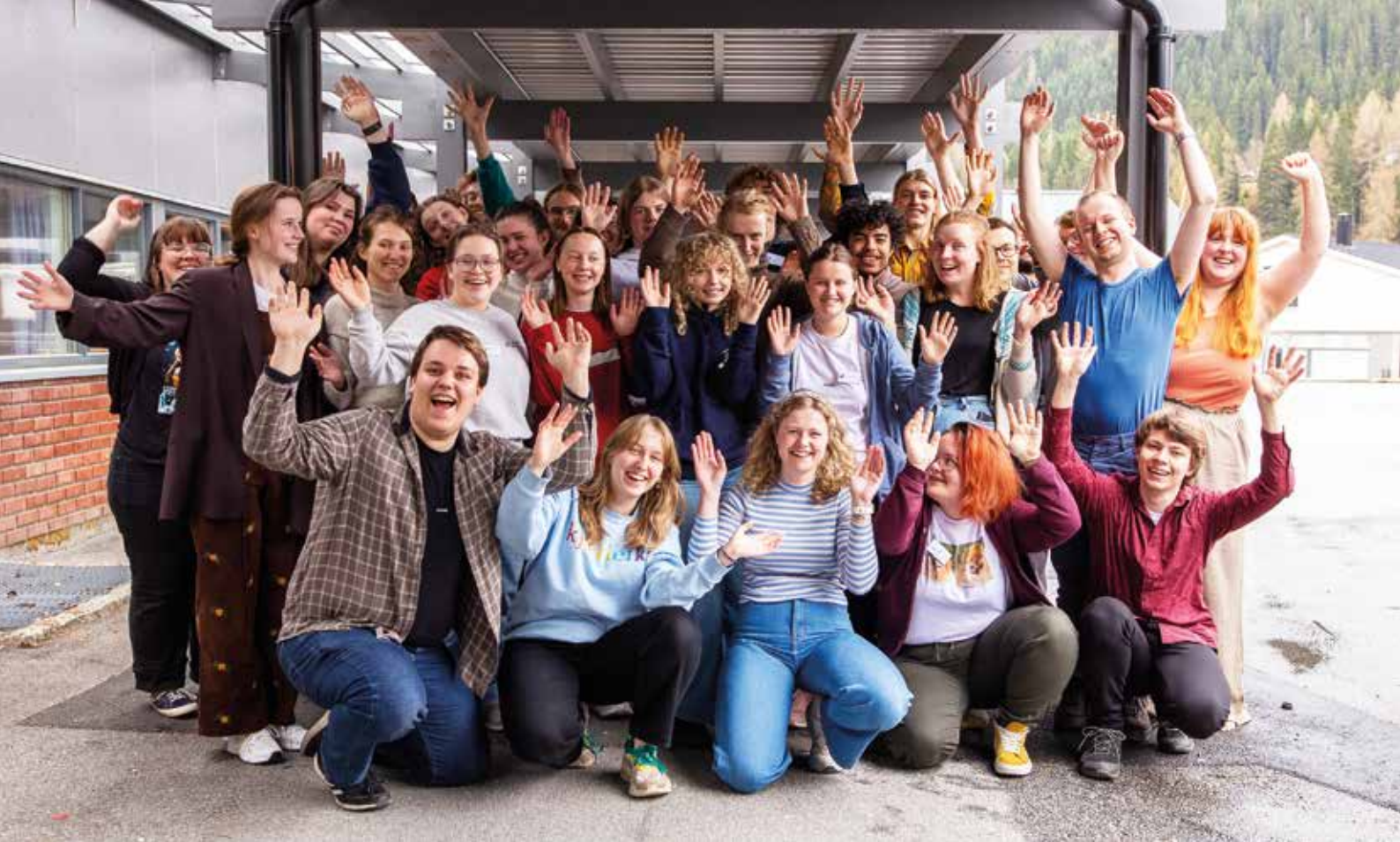
Topp steming på landsmøtet i Sogndal i 2023!

I 2023 var landsmøtet vårt i Sogndal, og i 2024 er det på Vinstra. Utover dette har vi også skipa til vinterleirar på Eina og Fosser, og ein haustkonferanse i Stavanger.